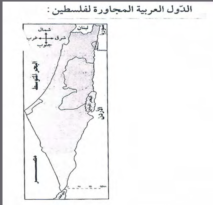
National Education Textbook, 4 th Grade

Most of the maps in PA school textbooks do not include the Green Line or any reference to Israel