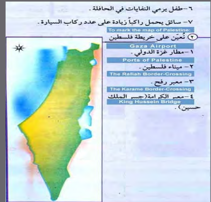
National Education Textbook, 3 rd Grade