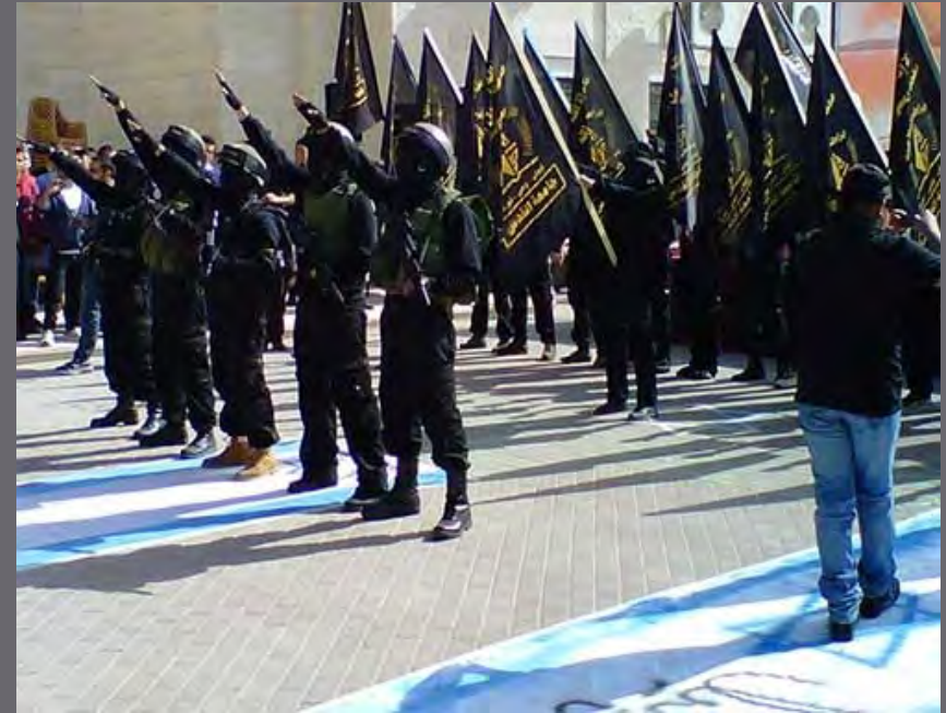
Students give Nazi salute in Al Quds University (November)