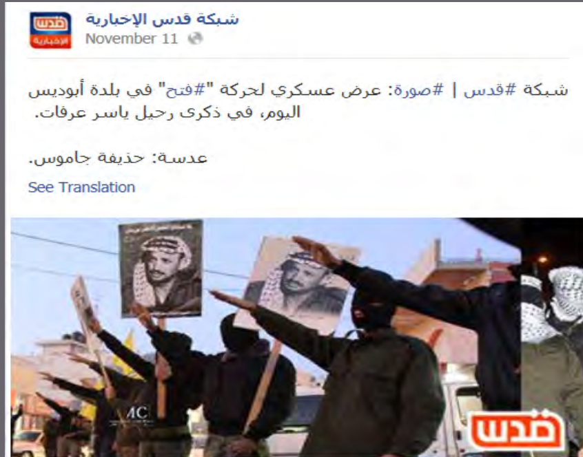
Fatah activists give Nazi salute in Abu Dis (November)